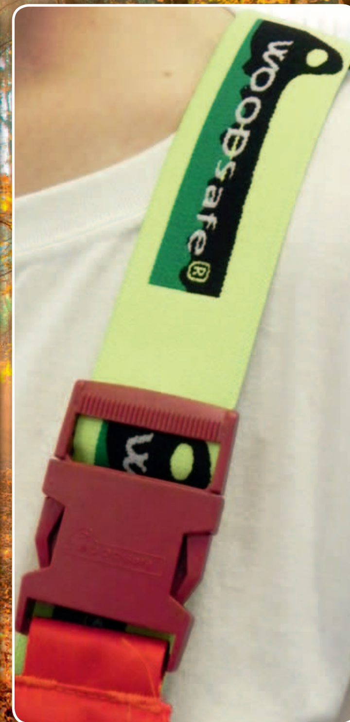
Farblich akzentuierte Hosenträger mit Logoprint