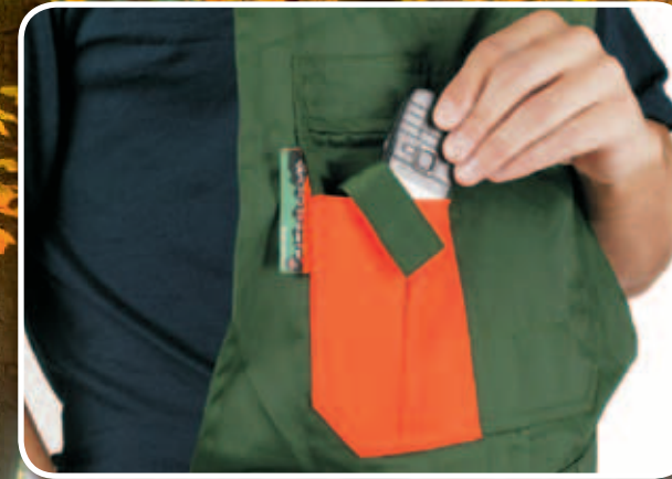
Latztasche mit Handytasche