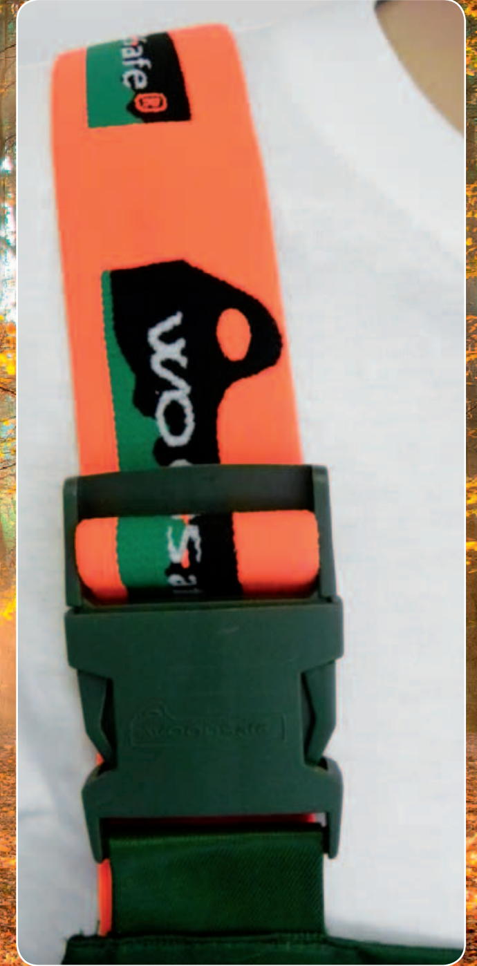
Farblich akzentuierte Hosenträger mit Logoprint