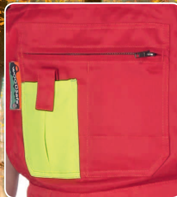
Latztasche mit Handytasche