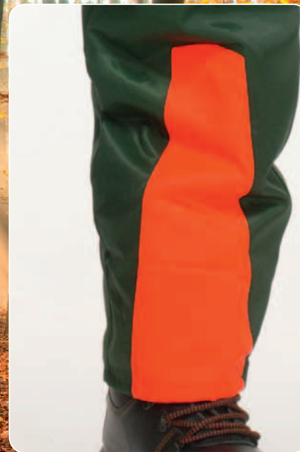
Warnkeile an den Hosenbeinen