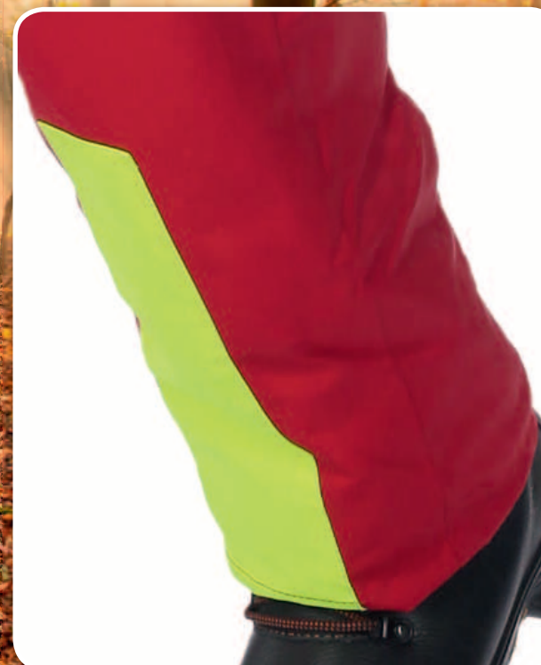
Warnkeile an den Hosenbeinen